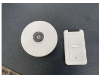
リモコン設置状況