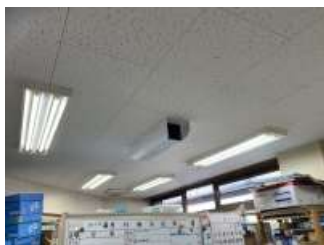
電源用天井埋め込みリモコン